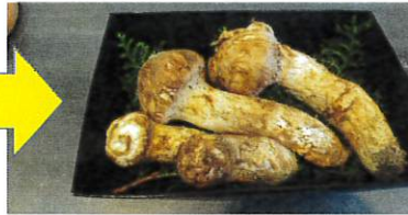
一晚、冷蔵庫で保管後の保温効果