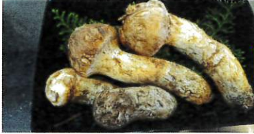
採れたての松茸を梱包